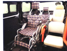
大きな車イスも乗せられます