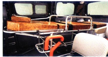
専用ストレッチャー