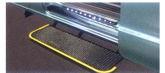
補助席・後部席は電動ステップ で楽に乗り降りができます。